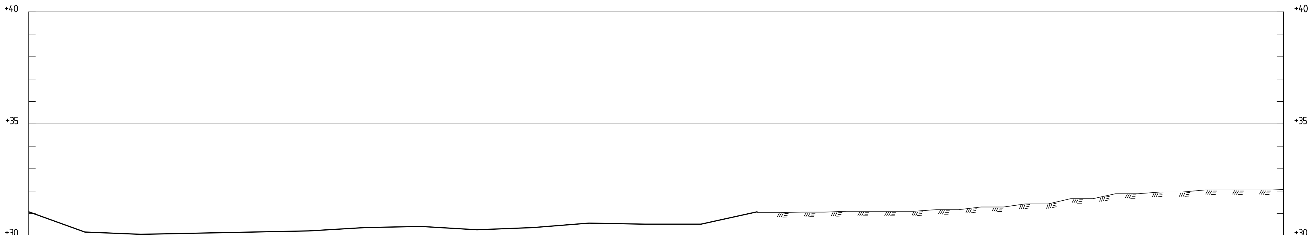
MON-Ö1.2 1: 100